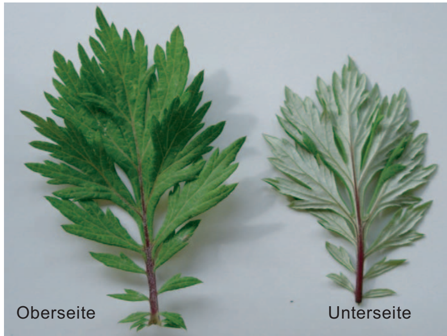
Gemeiner Beifuss: Blattunterseite weiss filzig